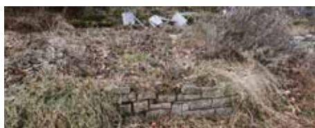
Gesucht: Not leidender Garten für leidenschaftliche Gärtnerin Bild mv

Nun tritt A auf den Plan: Menschenfreund*in und im Besitz eines (Gemüse-) Gartens, den sie oder er nicht bewirtschaften kann (sei es, weil die Kräfte nachlassen oder die Zeit/der grüne Daumen fehlt). A ist (noch) unbekannt, liest aber diesen Ar-