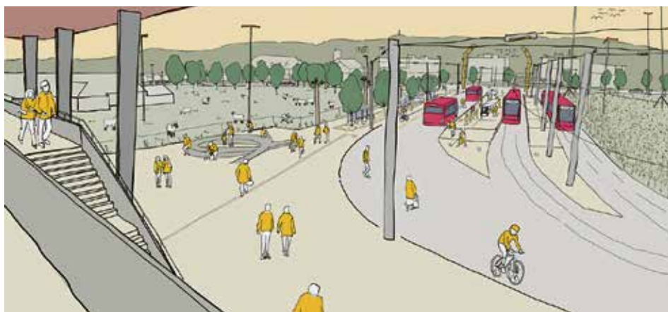
ÖV-Knoten voller Leben – inklusive Insektenhotel... Visualisierung Gemeinde Köniz

Die Idee «Tramlinienverlängerung nach Kleinwabern» ist mittlerweile rund 50 Jahre alt. Immer wieder gab's Anläufe, und immer wieder versandeten diese. Seit bald 15 Jahren ist klar: Es besteht breiter Konsens, dass das Nünitram nach Kleinwabern verlängert werden soll. Zunächst war von einer Inbetriebnahme bis 2018 die Rede. Seitdem der Kanton entschied, die Tramlinienverlängerung mit einem neuen ÖV-Knoten auf der Balsigermatte zu verknüpfen, und hierfür auf Bundessubventionen setzte, verzögert sich jedoch das Vorhaben: Im Vorfeld der Volksabstimmung im Herbst 2014 wurde noch das Inbetriebnahme-Ziel 2021 kommuni-