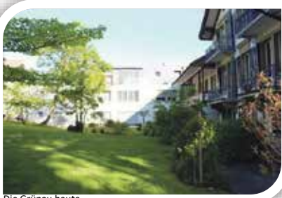
Die Grünau heute

Das Zuhause für pflege- und betreuungsbedürftige betagte Menschen in Wabern