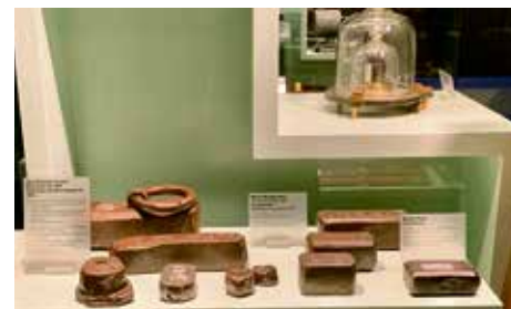
Museum METAS: «Standardgewichte»