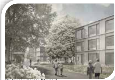
Die Grünau morgen (Neubau)