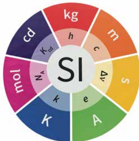
SI = Système International d'unités/Internationales Einheitensystem

Nebst den vorgegebenen Aufgaben für den Bund und die Kantone erhält das METAS auch direkte Aufträge aus der Industrie aus dem In- und Ausland. Homeoffice ist nur bedingt möglich, weil teilweise mit hochspezialisierten Apparaturen und in besonderen Räumen gearbeitet wird.