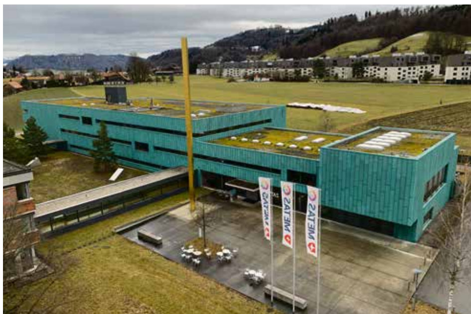
Blick aus dem Turm auf den Erweiterungsbau und die vergoldete Stele