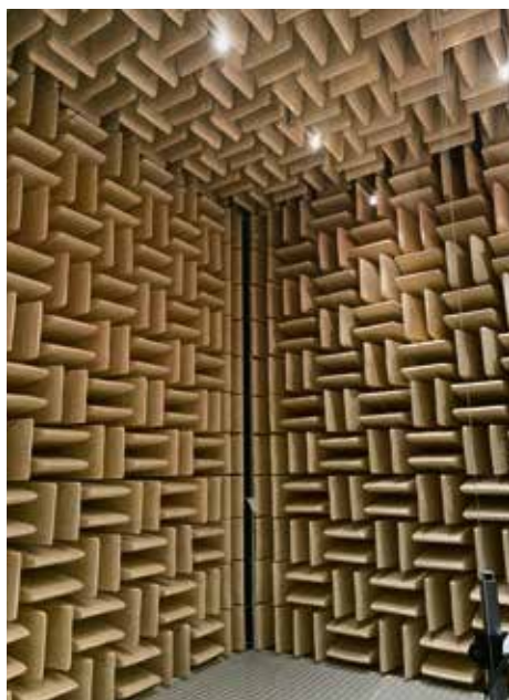
Spezialraum für akustische Messungen

Das METAS ist in der Schweiz das Kompetenzzentrum für alle Fragen des Messens, für Messmittel und Messverfahren. Im gesetzlichen Messwesen führt es die Oberaufsicht, aber jeder Kanton hat eigene Eichstellen und Eichmeister, welche vor Ort messen und prüfen.