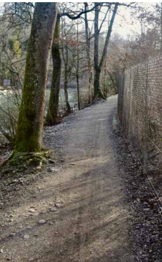
Uferweg heute: Sehr schmal und erosionsgefährdet. Nach dem Hochwasser vom letzten Juli musste ein kleiner Wegabschnitt bereits provisorisch repariert werden

In gut sechs Monaten sollen die Bauarbeiten im Abschnitt Eichholz/Dählhölzli starten – demnächst erfolgt die Baumeisterausschreibung durchs Kantonale Tiefbauamt. Parallel zur Ufersanierung wird die Gemeinde Köniz den 280m langen Uferwegabschnitt entlang des Pro Natura Zentrums Eichholz verbreitern.