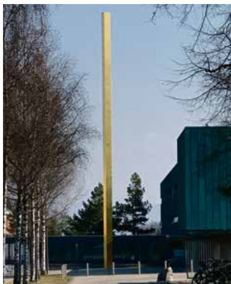
Die Masse 60 \times 60 \times 24 symbolisieren die Zeit: 60 Sekunden, 60 Minuten und 24 Stunden

Bereits 1862 wurde in Bern die Eidgenössische Eichstätte gegründet. 1909 entstand daraus das Eidgenössische Amt für Mass und Gewicht. Es bezog 1914 einen