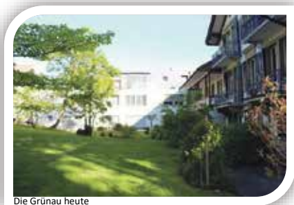
Die Grünau heute

Das Zuhause für pflege- und betreuungsbedürftige betagte Menschen in Wabern