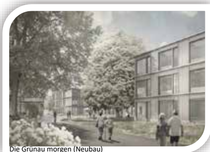
Die Grünau morgen (Neubau)