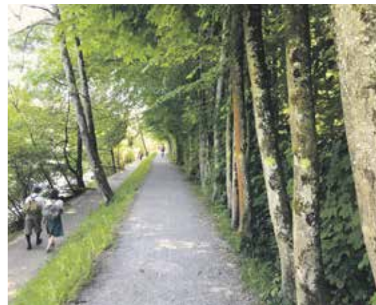
Markierte Bäume entlang Uferweg/Hauptwasserleitung: Lebensverlängerung um einige Jahre zugesichert.

Die Opponenten schlagen als Alternative die offizielle Aufhebung des Fusswegs entlang der Hangkante mit physischen