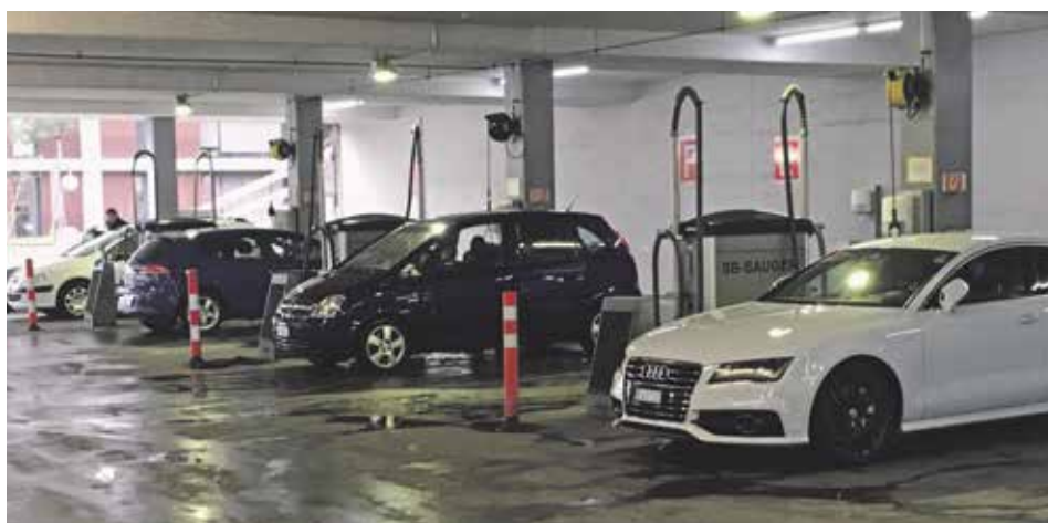
Bei der Tankstelle dürfte die neue Konkurrenz in Kehrsatz und Belp stark spürbar sein. Beliebt bleiben hingegen die Autopflegeplätze.

Dass an diesem Standort eine extensive, bloss eingeschossige Nutzung nicht optimal ist, leuchtet ein. Auch die kürzliche Ortsplanungsrevision ortete auf dieser Parzelle grosses Potenzial für eine bauliche Verdichtung; doch die rund 40 Jahre alte Überbauungsordnung (UeO) lässt bloss gewerbliche Nutzung zu – und an zusätzlichen Büroflächen besteht auf lange Sicht kein Bedarf. Die überfällige Revision der UeO wurde allerdings noch nicht angepackt. Vielmehr teilte der Könizer Gemeinderat kürzlich mit, dass wegen Arbeitsüberlastung der Planungsbehörden diverse Planungsvorhaben zeitlich gestreckt werden müssen, unter anderem jenes in Kleinwabern.