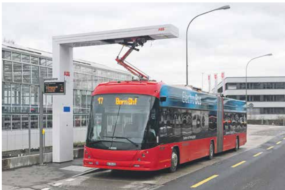
Umstellung der Busflotte auf Elektrobetrieb: Linie 17 als Vorreiterin