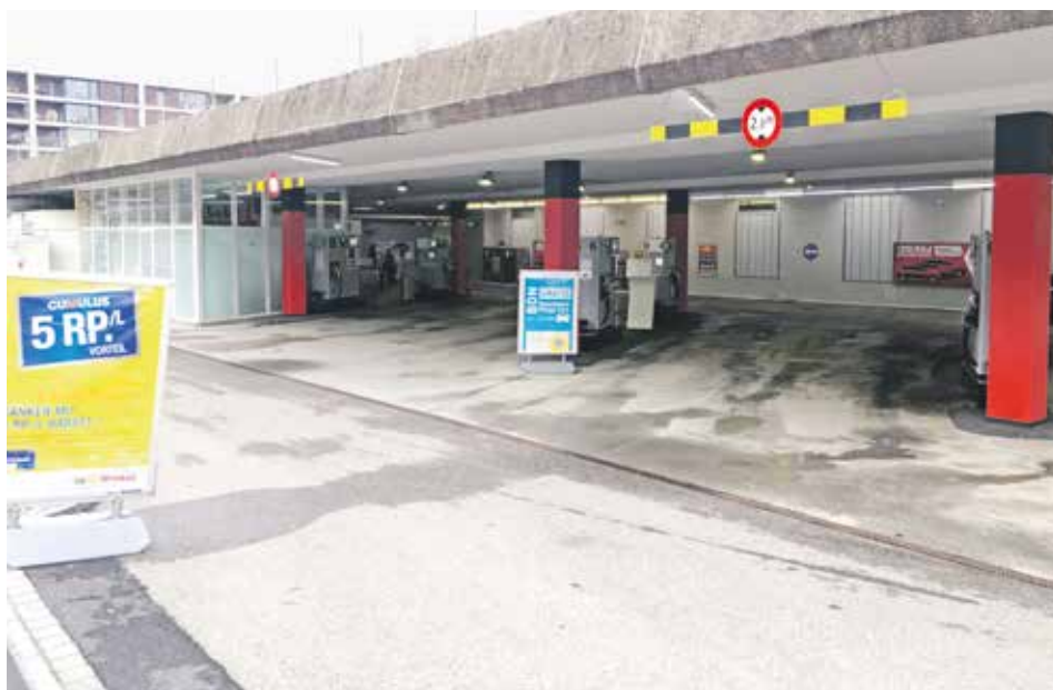
Die Tage der Tankstelle und Autowaschanlage sind gezählt – oder doch nicht?

Eine solche UeO-Revision braucht allerdings Zeit – sie dürfte im besten Fall im Jahr 2023 abgeschlossen sein. Tankstelle, Shop, Autowaschanlage und Autopflegeplätze (mit der ganzen Angebotspalette von Öl-Bar bis zu Mattenklopfer und Luftboy...) werden daher wohl nicht so schnell verschwinden. Der Rückbau respektive Abbruch von rund 1200 m 3 Beton und 1100 m 3 übrigen Materialien wird mit grosser Wahrscheinlichkeit nicht, wie im Baugesuch angegeben, diesen Frühling erfolgen. Und was die baupublizierte «Begrünung» betrifft, sind Öko-Illusionen ohnehin fehl am Platz.