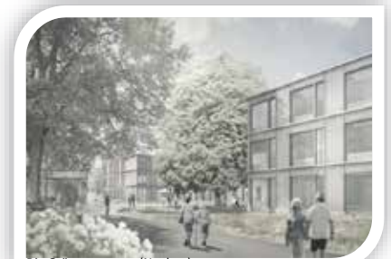
Die Grünau morgen (Neubau)

Wir sind auch während der Bauphase für Sie da!