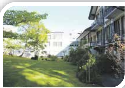
Die Grünau heute

Das Zuhause für pflege- und betreuungsbedürftige betagte Menschen in Wabern