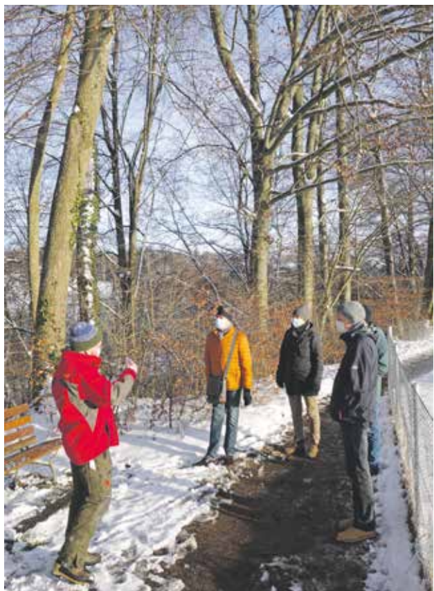
Unbestrittenes Sicherheitsproblem, umstrittene Lösung