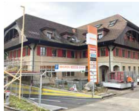
Umnutzung zu Wohnraum: In Bälde werden im vormaligen Gasthof Maygut nicht weniger als 29 neue, mehrheitlich kleine Wohnungen bezogen werden.