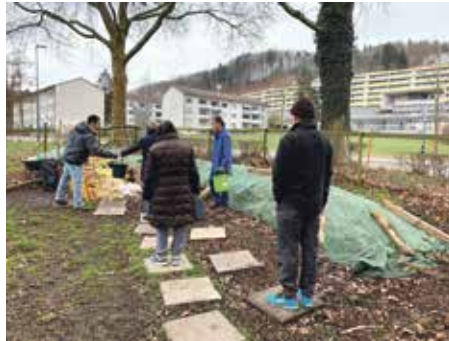
Der Kompostplatz ist am Samstagmorgen gut besucht.