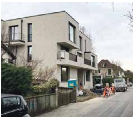
Verdichtung und moderner Look an der Alpenstrasse: fünf Wohnungen anstelle zuvor einer Wohnung.