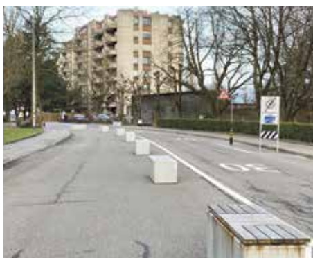
Echte planerische Knacknuss: Wie bringt man in einer bis zu elf Meter breiten Quartierstrasse die Fahrtempi auf ein quartierverträgliches Mass runter?

50 Metern wieder in eine Tempo-30-Zone ein, um kurz danach entweder links in die Funkstrasse (Begegnungszone Tempo 20) oder geradeaus in den Tempo-50-Bereich Bondelistrasse zu gelangen: Vier verschiedene Temporegimes auf bloss 150 Metern Länge.