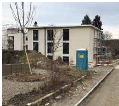
Lückenschliessung am Pappelweg – unter Inanspruchnahme der einstigen Gasbahn-Trasse.