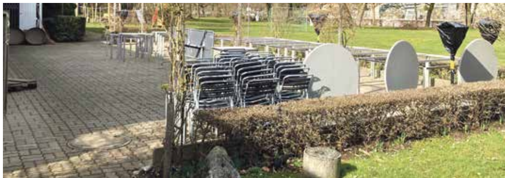
Bald werden Campingplatz und Restaurant Serini aus dem Winterschlaf erwachen.