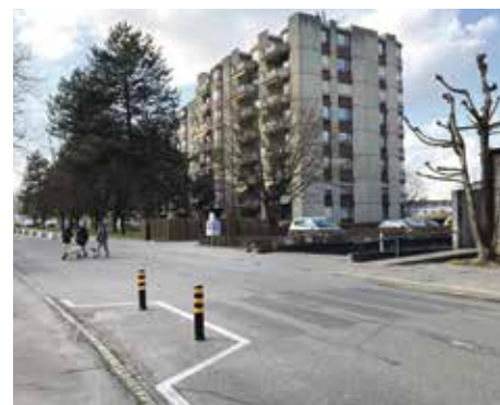
Klar, dass in der neuen Begegnungszone der Fussgängerstreifen auf Höhe des Kindergartens aufgehoben werden musste.