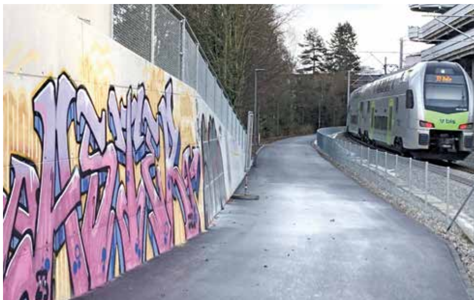
Der Wegabschnitt Bahnhof Wabern bis SRK ist seit Ende Januar offen. Ein Plakat kündigt für Frühling eine «Wandgestaltung zum Thema «ehemalige Gaswerkbahn» durchs Team Farbtube an.

Die Gemeinde Köniz realisiert den Fuss- und Veloweg weitgehend entlang der Bahngleise zwischen dem Bahnhof Wabern und dem Zentrum Kleinwabern und bietet dadurch eine direkte Verbindung und sichere Alternative zur stark befahrenen Seftigenstrasse. Verschiedene alte und neue Quartierteile werden damit besser vernetzt.