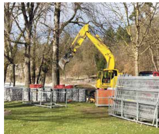
Die Hilfsbrücke ist längst weg, und die Zäune sind schon abgeräumt; doch fertig sind Ufersanierung und Uferwegverbreiterung noch nicht ganz: Dank Niedrigwasserstand kann der Bagger die Steinkörbe quer durch den Fluss zum anderen Ufer transportieren.