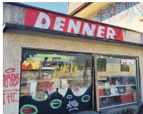
Der Denner-Schriftzug an der Seftigenstrasse 294.

Gegenüber nau.ch weist Denner jede Mitschuld von sich und bestreitet, dass es sich um eine Guerilla-Werbeaktion des Detailhändlers handle. Man freue sich einerseits zwar, dass Denner schweizweit eine grosse Fangemeinde habe, möchte die Fans aber motivieren, ihre Freude zu zügeln und keine illegalen Graffitis mehr an den Wänden anzubringen, sagt der Denner-Sprecher. Jonathan Spirig