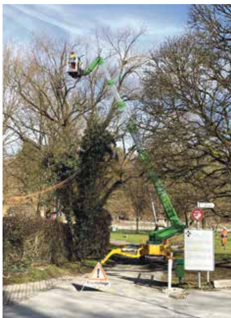
Aufwendige Baumpflege: Sicherheit hat Priorität.