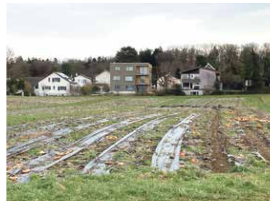
Drei Geschosse neu auch im unteren Maygut – theoretisch könnte noch deutlich dichter gebaut werden.