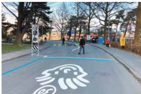
Bondelistrasse: kürzeste Tempo-30-Zone weit und breit

Wer aus der Tempo-30-Zone Kirchstrasse kommend am Knoten Bondelistrasse (Tempo 50) rechts abbiegt, tritt nach