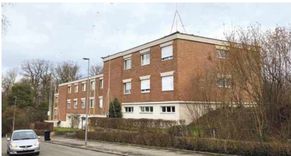
Am Lindenweg 56/58 plant die auf Gemeinnützigkeit verpflichtete Wohnbaugenossenschaft Neuhaus (seit 1967 Baurechtnehmerin auf dem METAS-Areal) eine umfassende Gebäudehüllensanierung (künftig mit Holzfassade) und Aufstockung um zwei Geschosse: Baustart möglichst noch vor Mitte Jahr und Bezug der acht neuen 4½-Zimmer-Wohnungen ein Jahr danach.