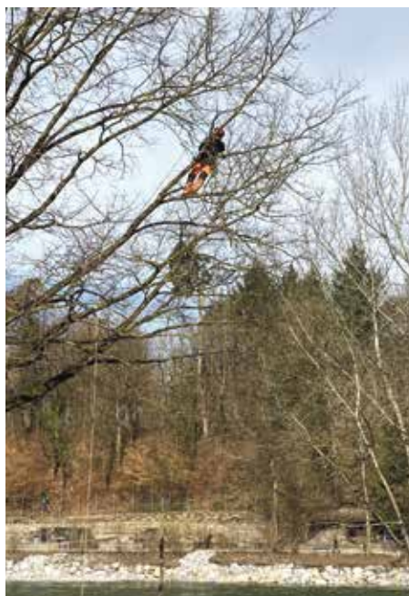
Lass dich nicht zu weit auf die Äste raus...