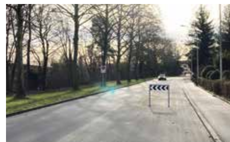
Der entsprechende Horizontalversatz in Gegenrichtung führte Ende Februar zu einem schweren Unfall.

zügig dimensioniert: acht Meter breit resp. vor der Einmündung in die Bondelistrasse sogar elf Meter breit. Verkehrsberuhigungsmassnahmen waren daher überfällig, zumal ein Kindergarten angrenzt. Dass nun nicht bloss Tempo 30, sondern sogar eine Begegnungszone (Tempo 20) signalisiert worden ist, ergibt angesichts des Sackgassen-Charakters Sinn.