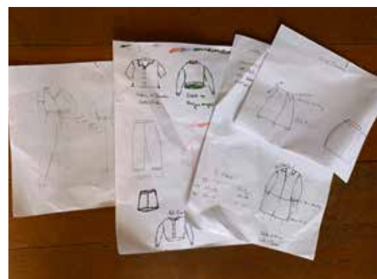
Zeichnung von Entwürfen