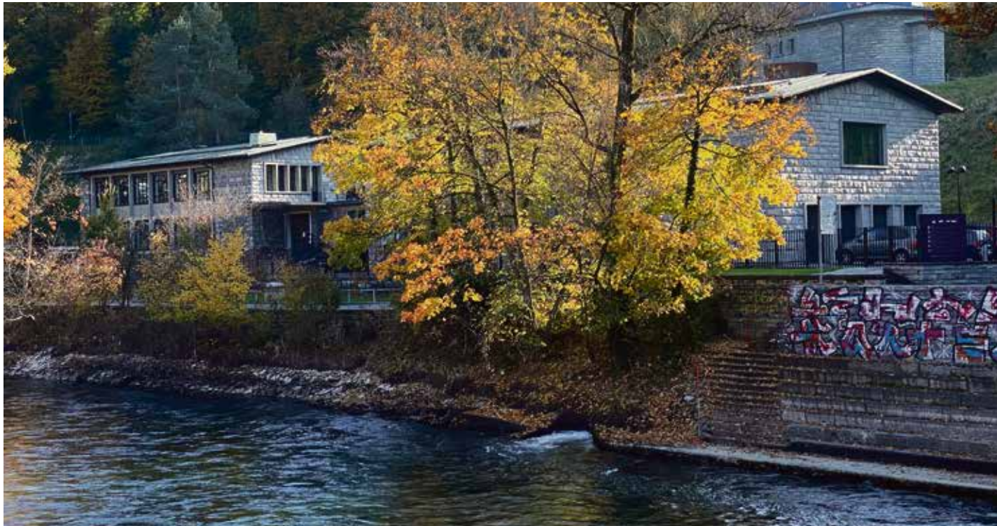
Das «Verwurfwasser», das beim Pumpwerk Schönau unmittelbar vor der breiten Treppenanlage in die Aare fliesst, wird künftig etwas kühler sein – für Flussschwimmer kaum merklich.

der Miteigentümergeinschaft (MEG) Morillon voraussetzt. Diese wird voraussichtlich noch diesen Herbst anlässlich der Eigentümerversammlung Beschluss fassen. Ein Teil der bestehenden Gasheizzentrale Morillon würde übrigens weiterhin genutzt, nämlich zur Spitzenlastdeckung in sehr kalten Perioden. Gemäss Projekt soll dies zumindest längerfristig mittels Biogas oder synthetischem Gas erfolgen, um das Ziel einer 100% erneuerbaren Wärmeversorgung zu erreichen. Sollte die Zusage der MEG Morillon ausbleiben, müsste die Wärmepumpenzentrale wohl – deutlich aufwendiger – unter der geplanten Betriebswendeschleife Sandrain realisiert werden.