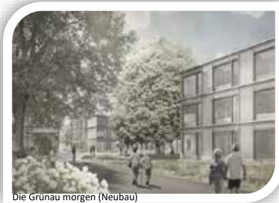
Die Grünau morgen (Neubau)