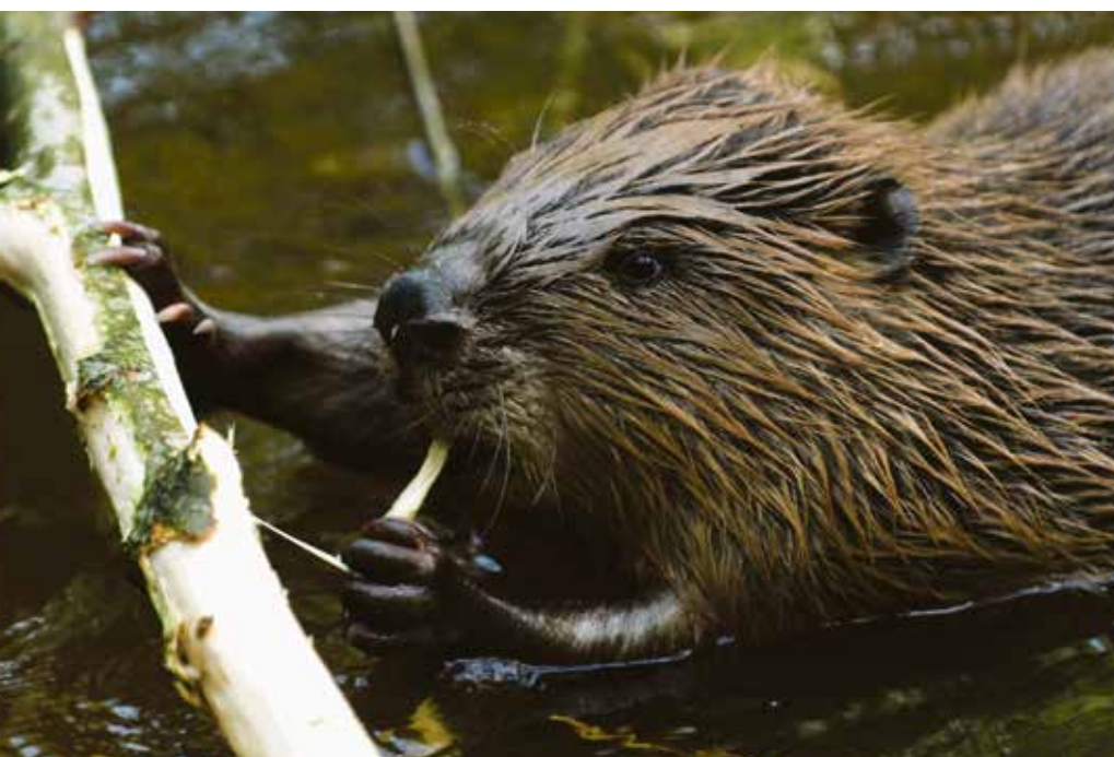
Mit Abstand am liebsten fressen Biber die Rinde von Weiden

Weil Biber ganzjährig aktiv sind, müssen sie ihren Körper vor dem Auskühlen im kalten Winterwasser schützen. Dies er-