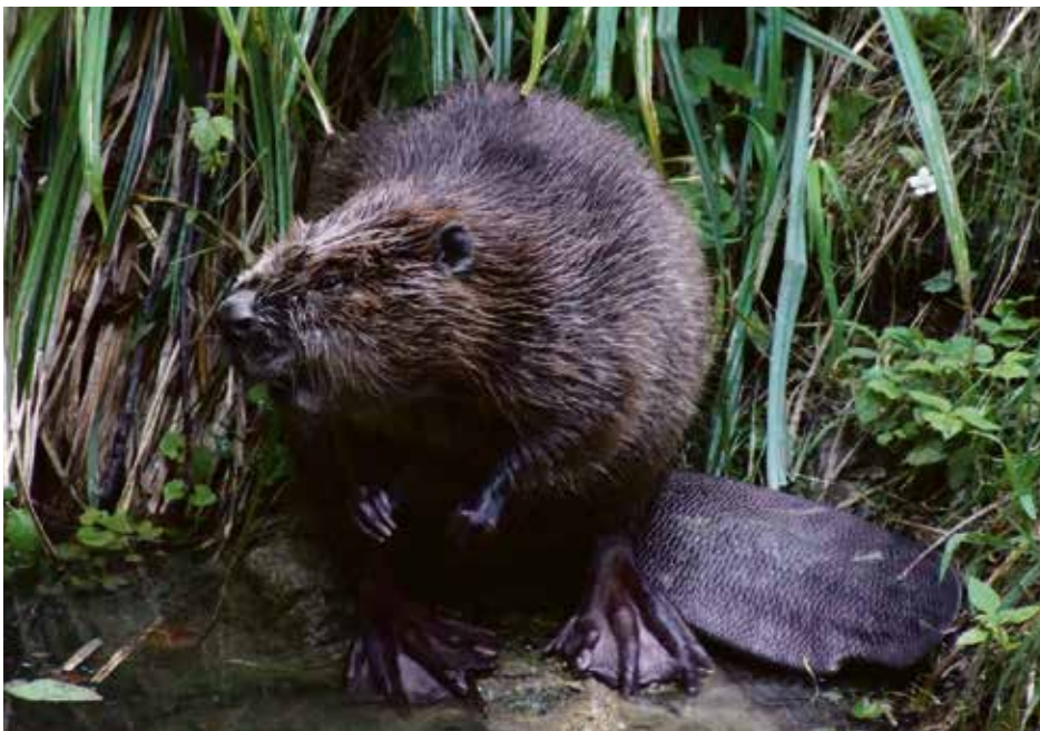
Bestens ans Leben im Wasser angepasst: grosse Füsse mit Schwimmhäuten, breiter, ledriger Schwanz zum Steuern und dichtes, wasserabstossendes Fell