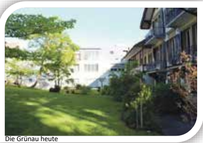
Die Grünau heute

Das Zuhause für pflege- und betreuungsbedürftige betagte Menschen in Wabern