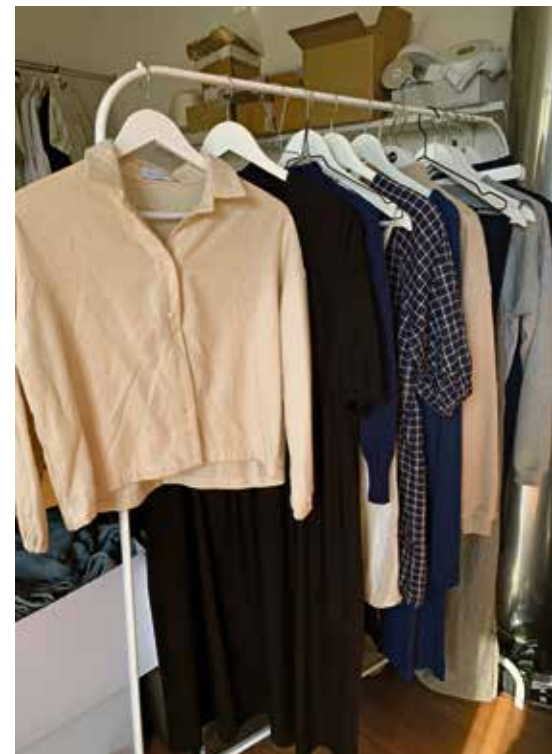
Die Kollektion in den typischen Farben