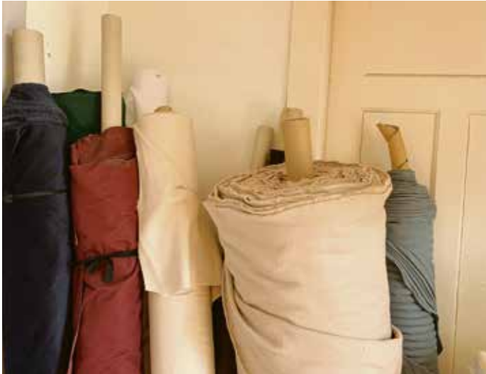
Stoffe in wunderbarer Qualität und in zeitlosen Farben