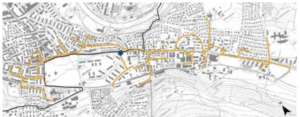
Geplantes Leitungsnetz des Wärmeverbunds Wabern-Bern. Blauer Punkt: anvisierter Standort der Wärmepumpen- und Spitzenlastzentrale.

Für die Wärmepumpenzentrale würden sich die Räumlichkeiten der bestehenden Gasheizentrale der Überbauung Morillon ideal eignen, was aber die Zustimmung