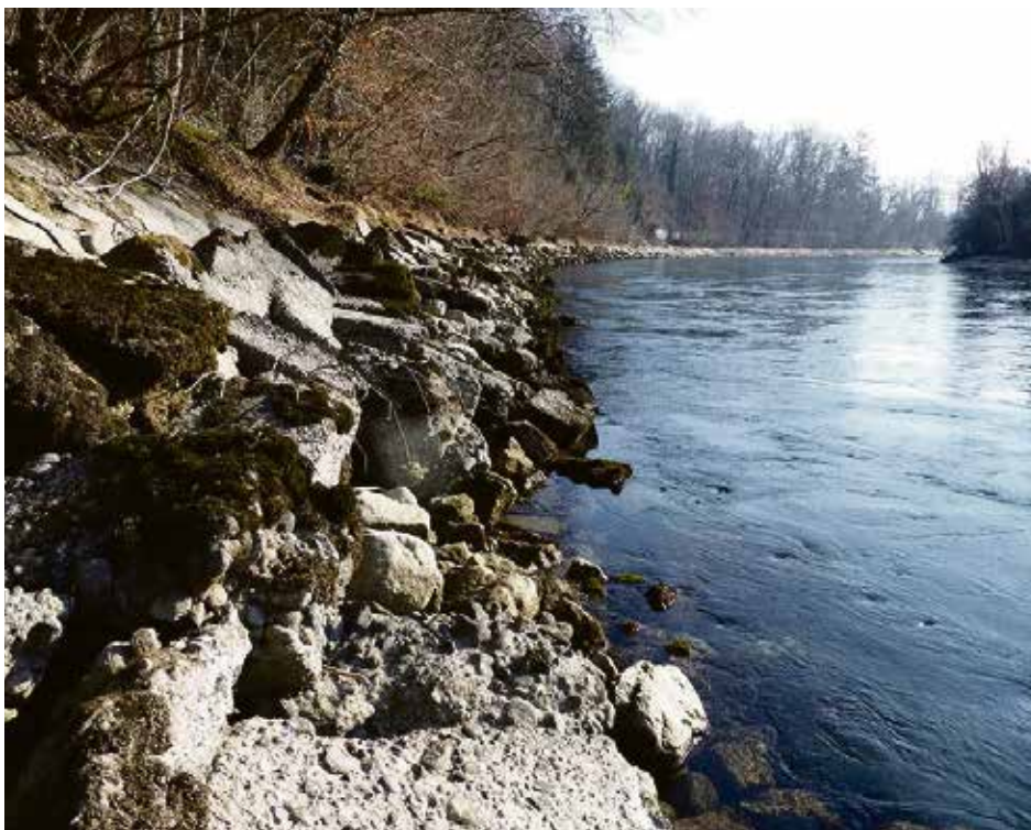
Defekte Uferverbauung im Bereich Dählhölzli