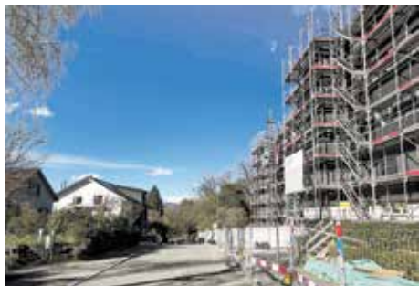
Lindenweg 56/58: Aufstockung um zwei Geschosse – der grosse Abstand zu den Bauten der METAS bleibt.