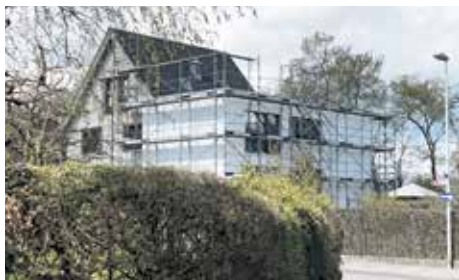
Gossetstrasse 35: Umgebautes Haus mit neuem Anbau: Seit langem bezogen; doch das Gerüst scheint sich festgekrallt zu haben.