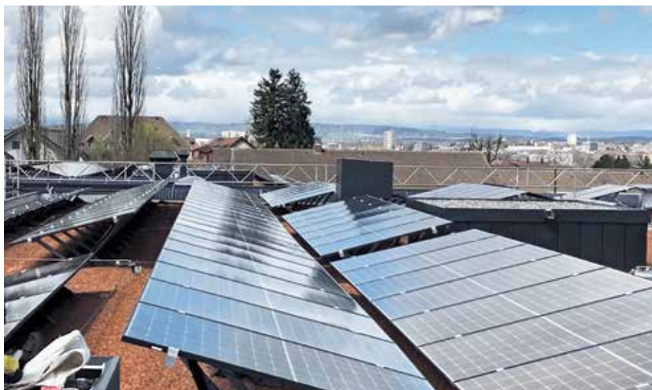
Grosse Photovoltaikanlage mit prächtiger Rundschau... Und auf der roten Bodenschicht (Ziegel-Bruch) werden künftig Pflänzchen gedeihen.