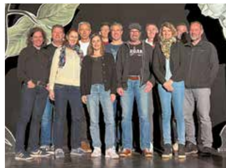
Lange Erfahrung, neue Motivation: die bisherigen und neuen Mitglieder des OK Wabere-Louf

Die Anmeldung ist auf www.wabere-louf.ch möglich.