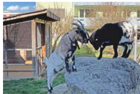
Auch diese Bewohner scheinen sich in der Grünau wohlfühlen – eine Attraktion für Jung und Alt.