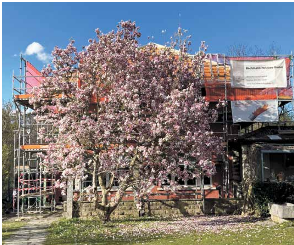
Eichholzstrasse 101: Frühlingserwachen auf der Baustelle.