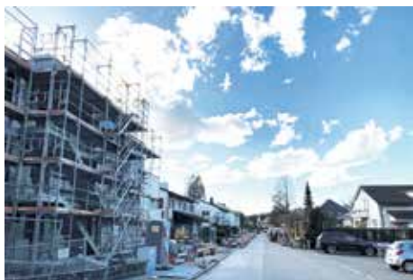
Eichholzstrasse 102: Vom EFH mit grossem Garten zur maximalen Parzellenausnutzung – voll im Trend.