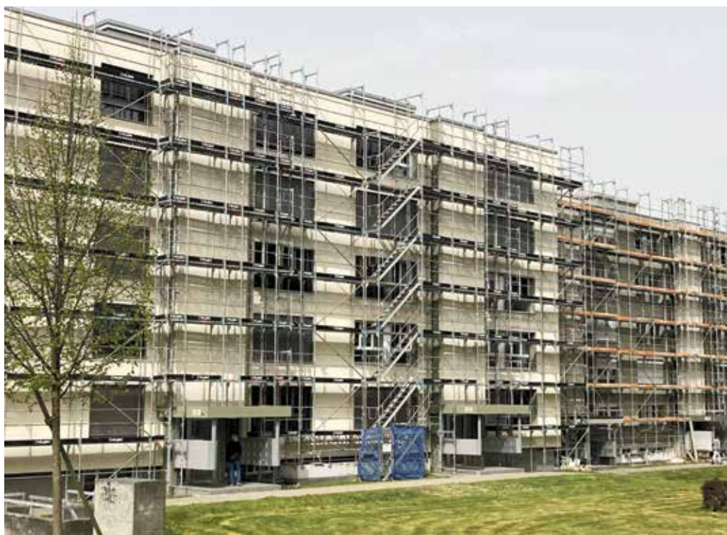
Funkstrasse 104/106: Etappenweise werden die Wohnblöcke Funkstrasse auf Vordermann gebracht.